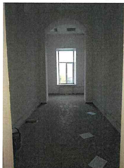
Фото № 11 (пом. 47-Н, ч.п. 4)