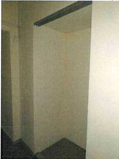
Фото № 8 (пом. 47-Н, ч.п. 1)