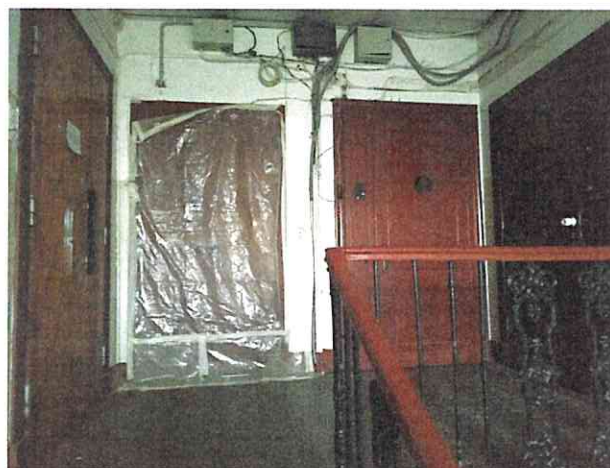
Фото № 18 (ч.п. 3)