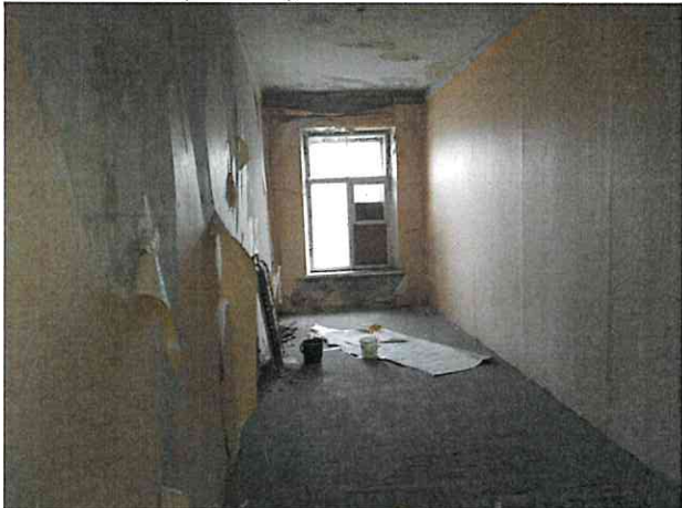
Фото № 15 (ч.п. 19)