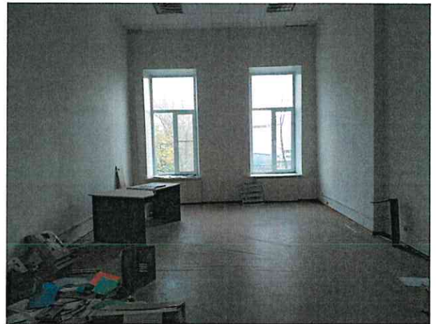
Фото № 9 (пом. 47-Н, ч.п. 8)