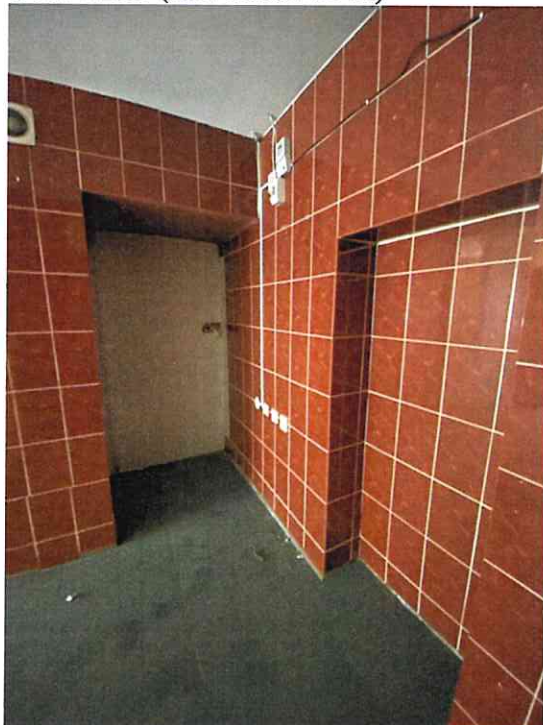
Фото № 19 (ч.п. 1 пом. 85-Н)