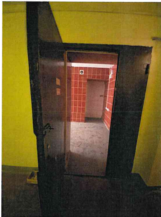
Фото № 18