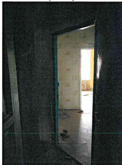
Фото № 21 (ч.п. 7)