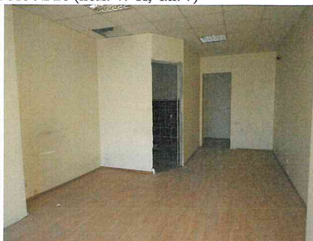
Фото № 27 (пом. 47-Н, ч.п. 6)