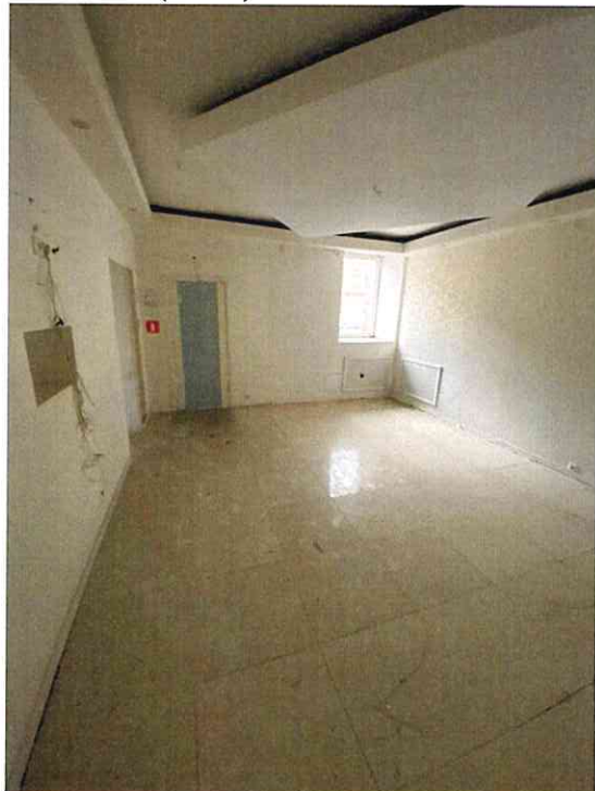
Фото № 7 (ч.п. 5)