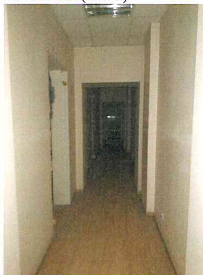
Фото № 23 (пом. 47-Н, ч.п. 6)