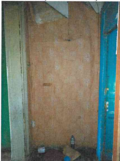
Фото № 9 (вход в ч.п. 6)