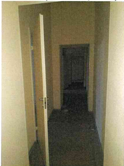
Фото № 10 (пом. 47-Н, ч.п. 2,3)