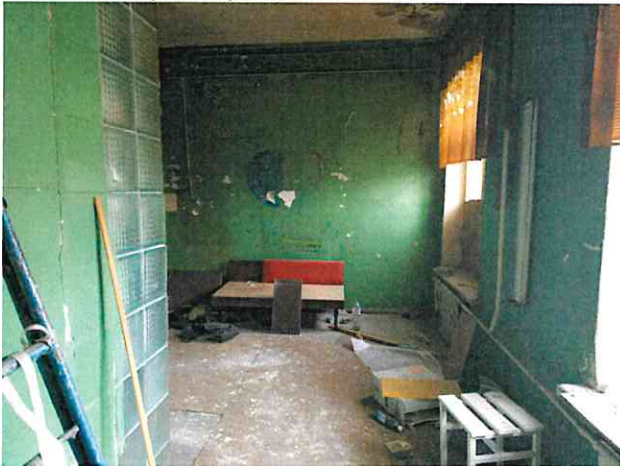
Фото № 3 (ч.п. 1)