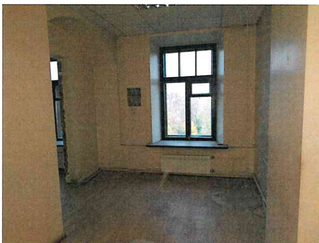
Фото № 22 (ч.п. 3)