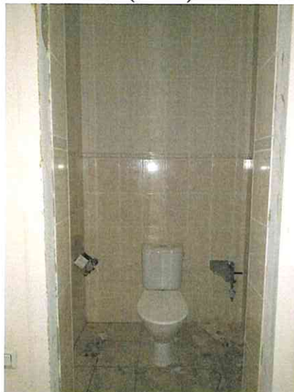
Фото № 29 (общий вход с улицы)