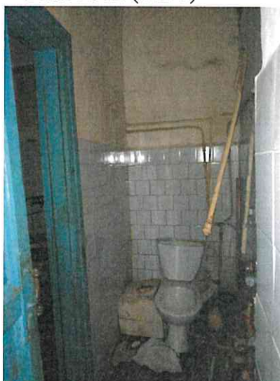
Фото № 10 (ч.п. 5)