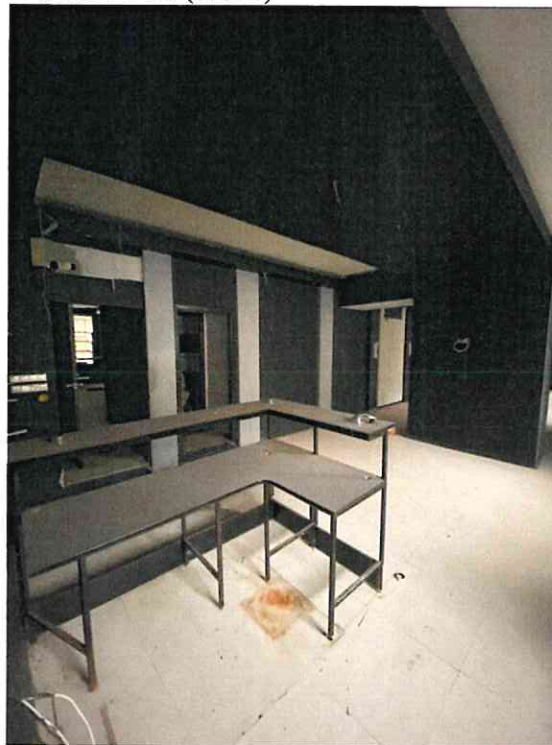
Фото № 10 (ч.п. 6)