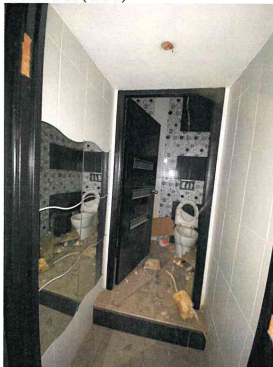
Фото № 14 (ч.п. 7)