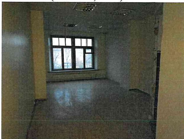
Фото № 26 (пом. 47-Н, ч.п. 7)