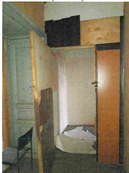
Фото № 14 (ч.п. 18)