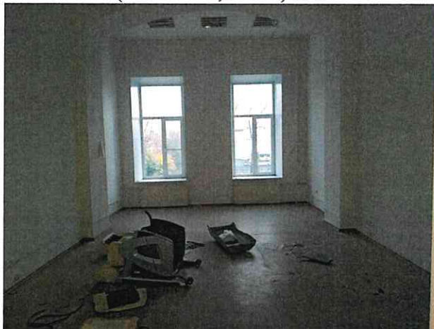
Фото № 12 (пом. 47-Н, ч.п. 4)