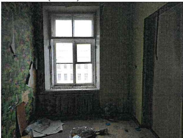
Фото № 24 (ч.п. 11)