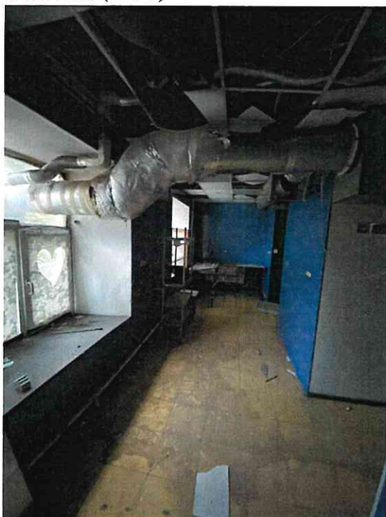
Фото № 3 (ч.п. 1)