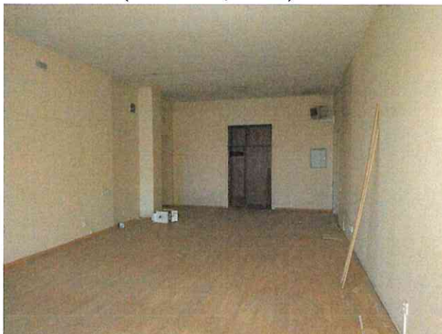
Фото № 20 (пом. 47-Н, ч.п. 7)