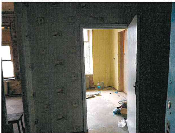
Фото № 23 (ч.п. 12)