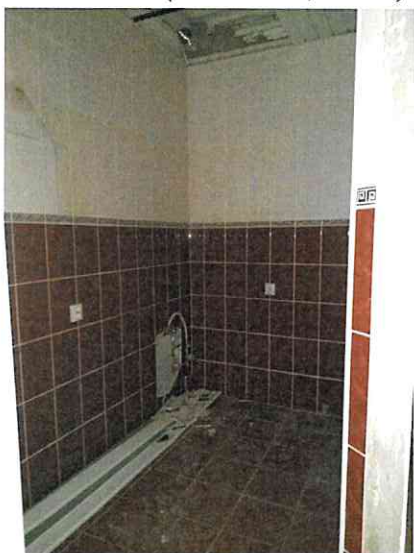
Фото № 28 (ч.п. 3)