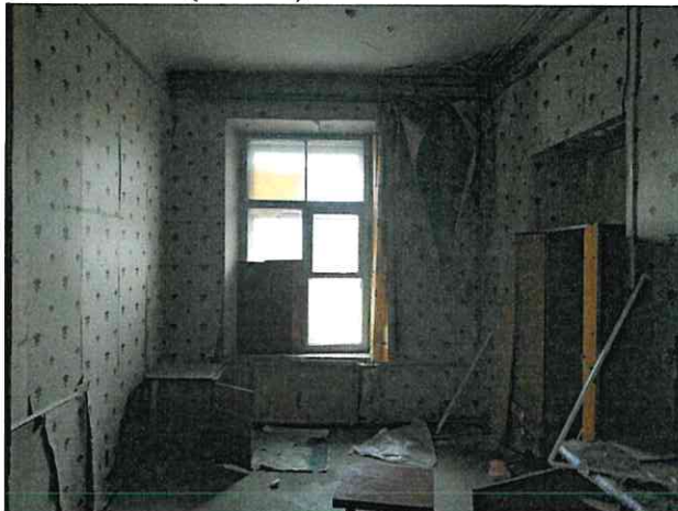
Фото № 26 (ч.п. 9)