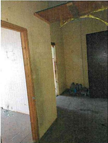
Фото № 17 (ч.п. 17)