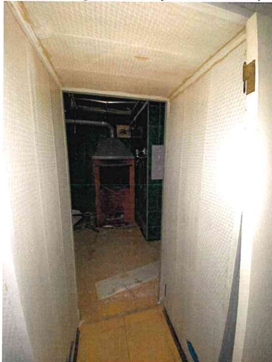
Фото № 5 (проход между ч.п. 1 и ч.п. 2)