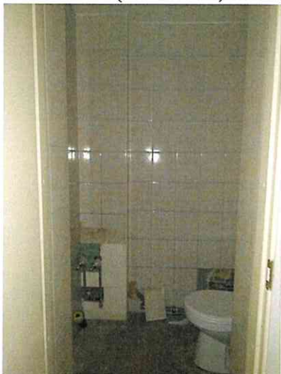
Фото № 17 (пом. 47-Н, ч.п. 6)