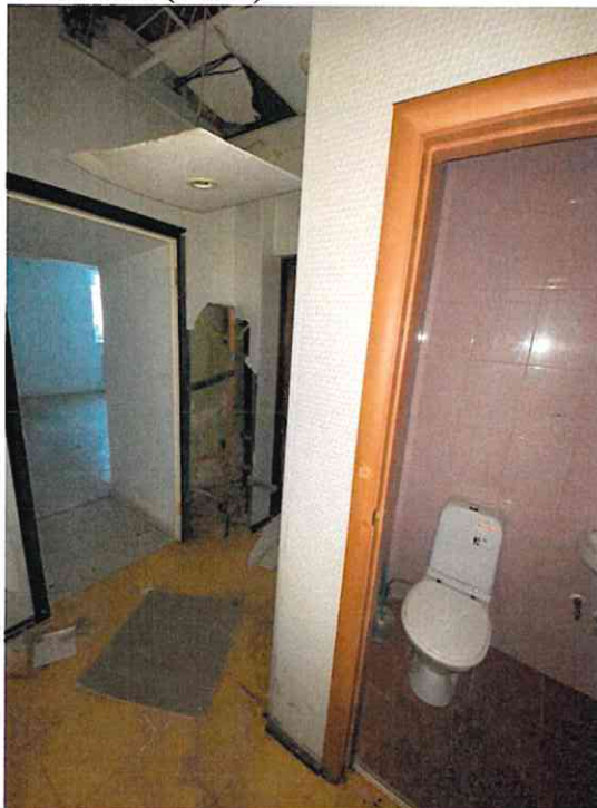
Фото № 6 (ч.п. 3)