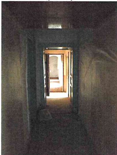
Фото № 22 (ч.п. 13)