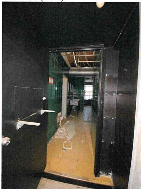
Фото № 15 (ч.п. 1)