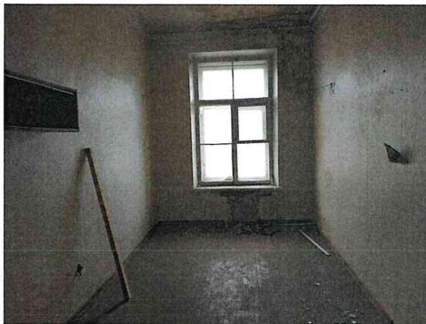
Фото № 20 (ч.п. 7)