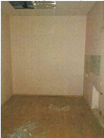
Фото № 24 (ч.п. 3)