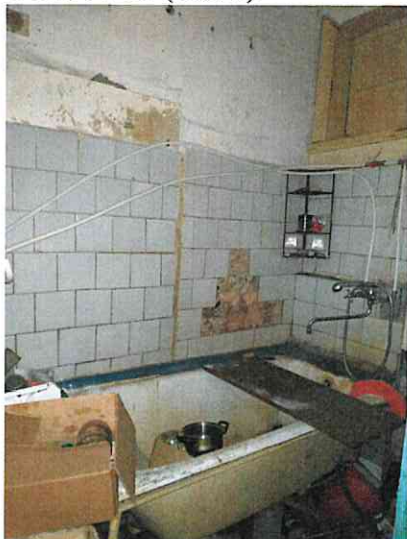
Фото № 11 (ч.п. 6)