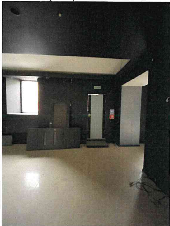
Фото № 13 (ч.п. 8)