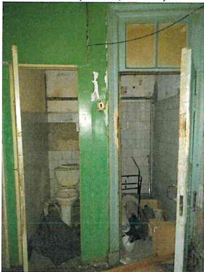
Фото № 7 (ч.п. 3, ч.п. 4)