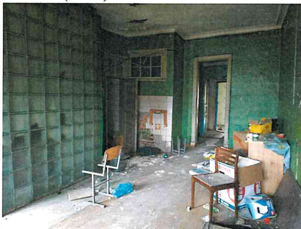
Фото № 4 (ч.п. 1)