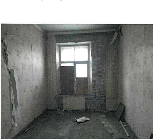
Фото № 28 (ч.п. 7)