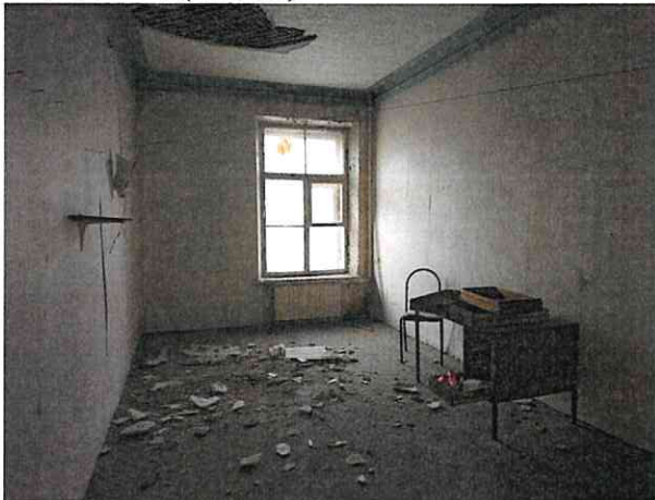
Фото № 16 (ч.п. 16)