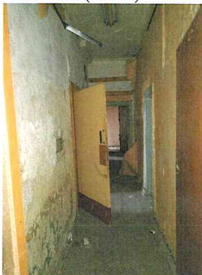
Фото № 8 (ч.п. 22)