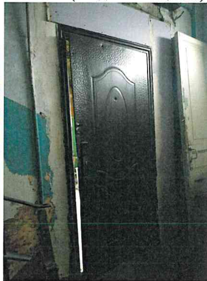
Фото № 2 (вход в помещение)