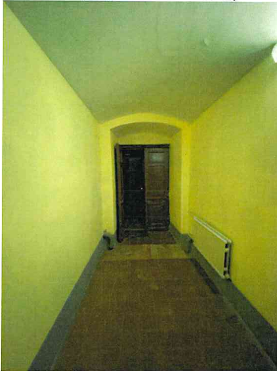
Фото № 17 (вход с ЛК в пом. 85-Н)