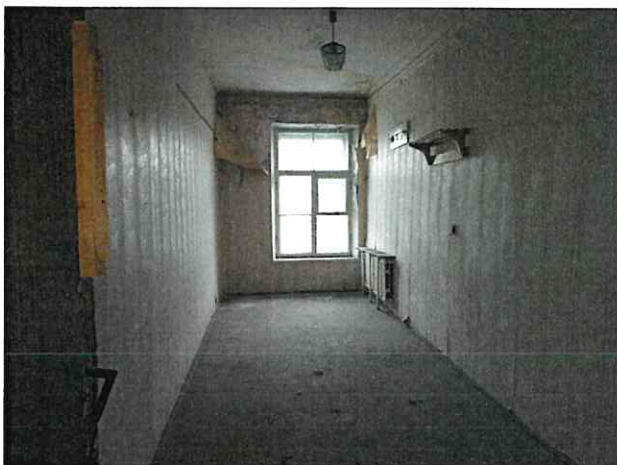
Фото № 13 (ч.п. 20)