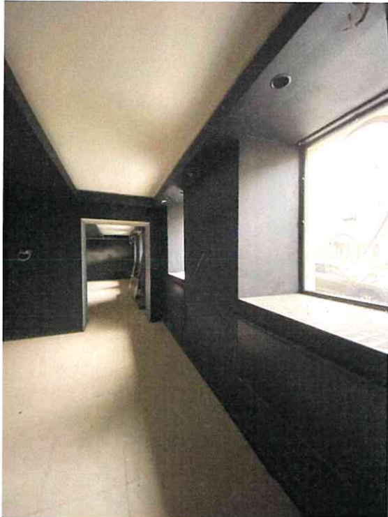
Фото № 9 (ч.п. 6)